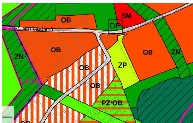
Zrušené propojení v novém ÚP

Bohužel pro záměr transformovat území osady Lahovská na obytnou plochu je stávající profil této stávající komunikace nevyhovující (je úzká, zatáčky jsou nepřehledné a výškový profil by si vyžádal vybudování opěrných zdí). Proto by si taková stavba vyžádala značný zásah do práv majitelů přilehlých pozemků a přinesla by s sebou značné investiční náklady. Navíc by vzhledem k malé velikosti přilehlých pozemků došlo jejich zásadnímu znehodnocení.